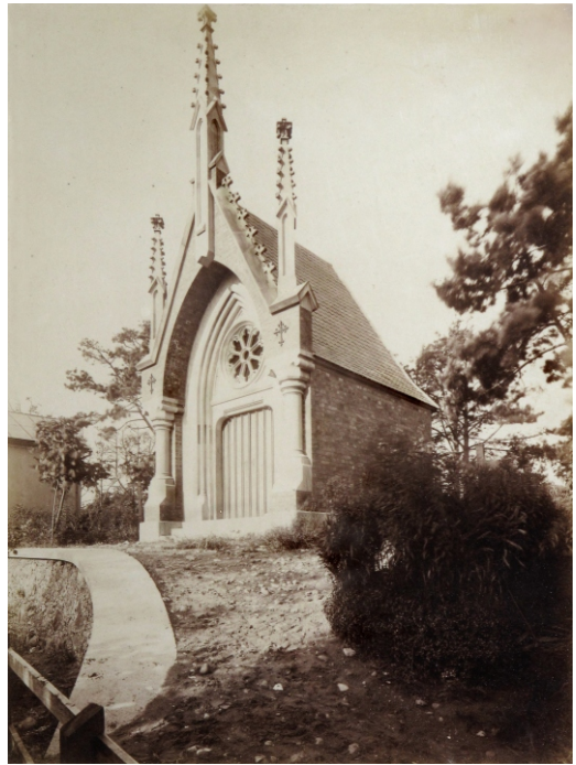
Antona Vites un Lorenca Hikes kapliņa. 1915. Mausoleum für Anton Witte und Lorenz Huecke. Foto 1915 (No Imanta Lancmaņa arhīva/ Aus dem Archiv von Imants Lancmanis)