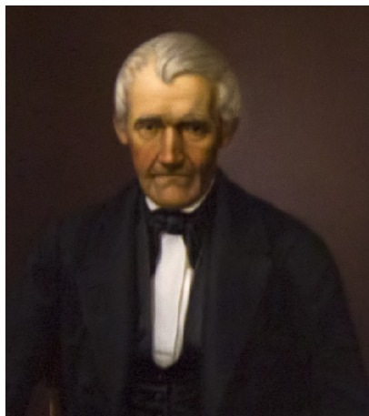
Dinas Frickausas foto/ Foto von Dina Frickausa