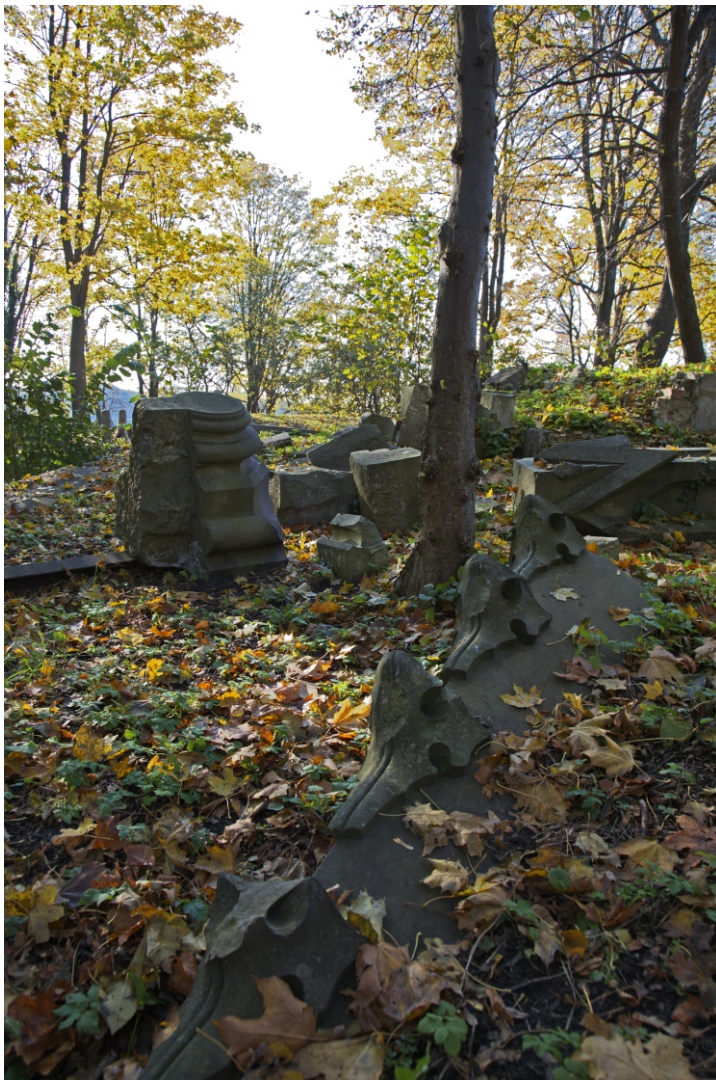
Antona Vites un Lorenca Hikes kapliņas paliekas Vecajos kapos. 2009.

Reste des Mausoleums für Anton Witte und Lorenz Huecke auf dem Alten Friedhof. Foto 2009